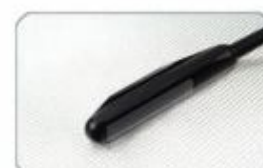
6.5Mhz Rectal Linear Waterproof

www.miglobaltech.com Email: sales@miglobaltech.com Phone: 786-597-1317